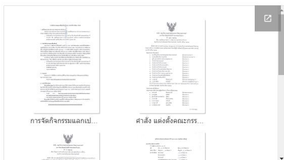
เอกสารกิจกรรม KM ปีการศึกษา 2562