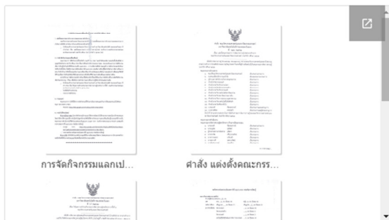
เอกสารกิจกรรม KM ปีการศึกษา 2562