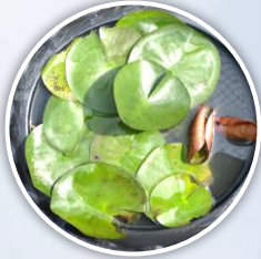
นำมาปลุกลงกระถาง