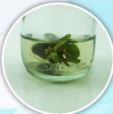
ชั่งน้ำยอด