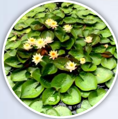
ต้นพืชรุ