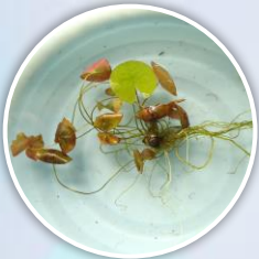
นำต้นกล้าย้ายออกปลูก