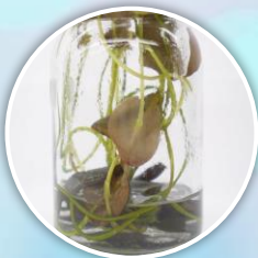
ชั่งน้ำราก