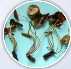
ชิ้นส่วนเริ่มต้น