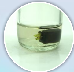
นำมาเลี้ยงในอาหารเหลว