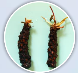
คัดเลือกชิ้นส่วนยอด